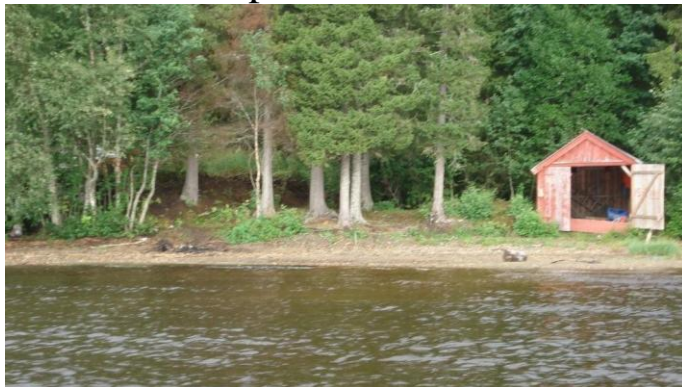
Bildet er tatt før oppbygging av gapahuk.

Arken, arbeid og aktivisering har en friluftsgruppe som er ute på tur hver fredag. Det var ønskelig å bygge opp et området som kunne være base for friluftsgruppen, etter hvert så man en mulighet for å få til et område som kunne benyttes av alle mennesker, uansett funksjonalitet. Friluftsgruppen skal ha Svartbekken som base, og har ansvaret for vedlikeholdet på området.