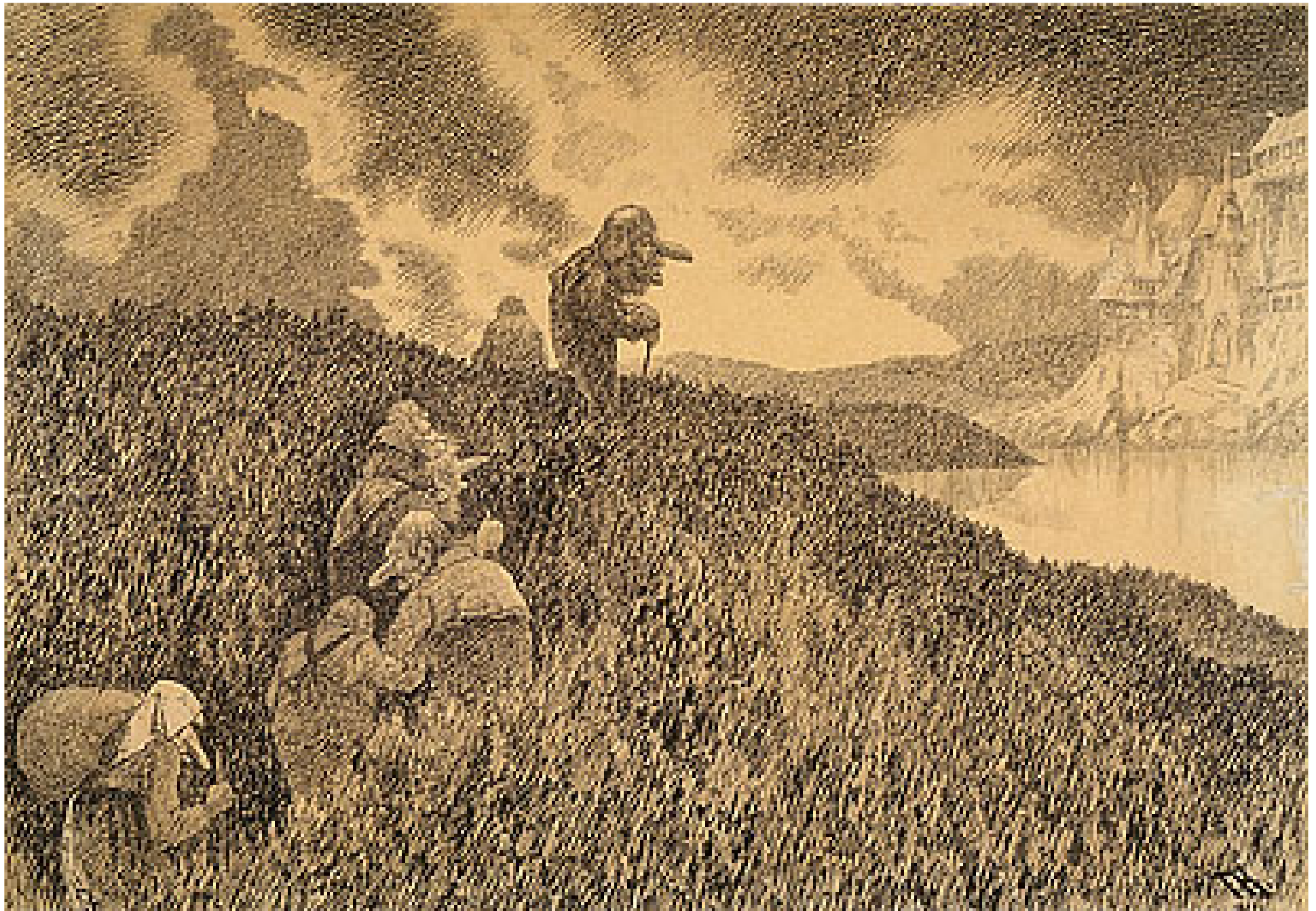
På vei til gildet i Trollslottet