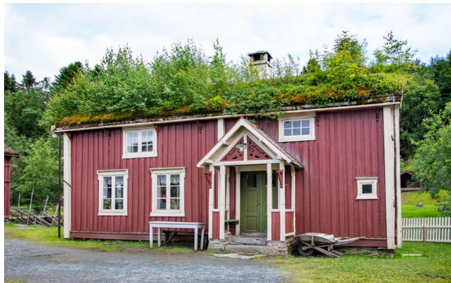
Vegvokterboligen slik den står i dag på Stiklestad friluftsmuseum.

Statens vegvesen eier Vegvokterboligen med tilhørende bur og uthus som ble satt opp på Stiklestad friluftsmuseum i 1987. Bolighuset og bur ble flyttet fra Vaterholmen mens uthuset er en rekonstruksjon av en uthusbygning fra Vemundvik ved Namsos. Boligen ble innkjøpt av staten i 1870 til bruk for en av de første fire vegvoktere i Norge. Disse riksvegvokterstillingene ble opprettet i 1866, og var starten på et moderne vegvesen med fast ansatte arbeidere.