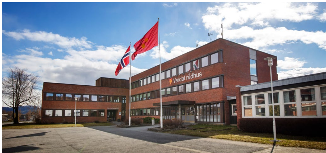
Fasaden på Verdal rådhus er et synlig symbol på Verdal si kobling mellom landbruksbygd og industrisamfunn. Foto: Øyvind Malum

Malså gruver , en gruvedrift som var det største bergverket i Verdal med en drift fra midten av 1700-tallet til 1918, med flere definerte driftsperioder. Smelteovnene i Malså ble bygget i 1875 og 1876. Kilde: Helgådalsnytt 2020, Joar Nessemo. I dag er det en smelteovn igjen, og den er i dårlig forfatning. Malsådalens venner har tilrettelagt området ved smelteovnen, gravene og graveminnene med informasjonsskilt og god merking. Det er i dag et viktig turområde og den merke stien er en av innfallsporene til Blåfjella-Skjækerfjella Nasjonalpark. Verdal kommune ønsker å arbeide sammen med Malsådalens venner om å få istandsatt den gjenværende smelteovnen.