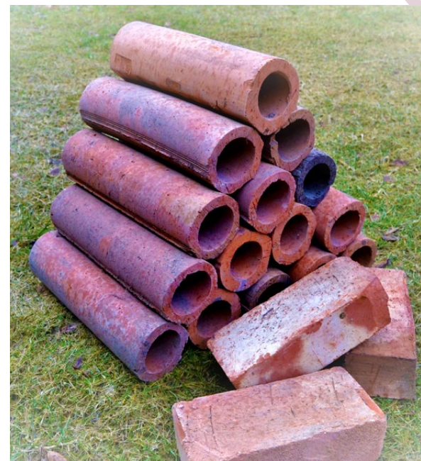
Teglstein og drensrør fra A/S Innherrad Teglverk på Stiklestad.