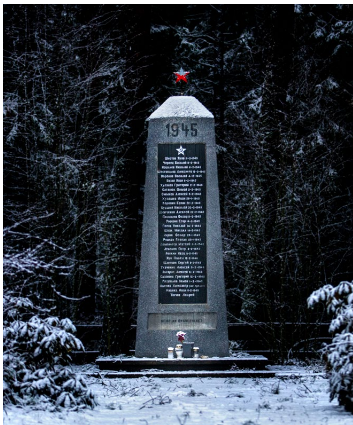
Krigskirkegården på Ørmelen.

Det som omtales her er minner og minnesmerker knyttet til 2. verdenskrig. Øvrige krigsminner er knyttet til ferdsselsleia østover og er omtalt i temadelen Jamtlandsvegen .