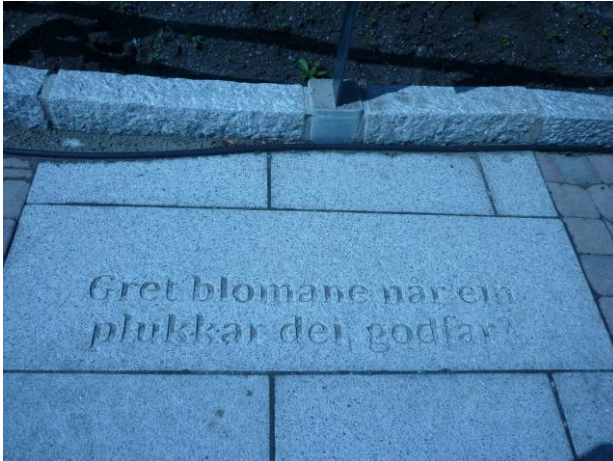
"Gret blomane når ein plukkar dei, godfar." Spelsitat.

Det er ingen kontrast i fargen mellom underlag og sitat, så sitatene kan være vanskelige å se. En bør her vurdere å male sitatene i en kontrastfarge til skifersteinene.