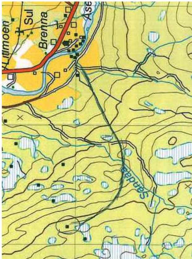
Opgitt kjørerute Grunnkart fra søknad)