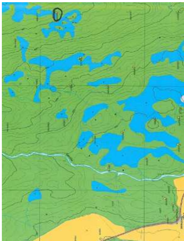
Området i detaljert utsnitt (blå områder er myr/våtmark)

Værdalsbruket som grunneier er forespurgt av kommunen, og mener saken er av en slik karakter at den må vurderes som vintertransport.