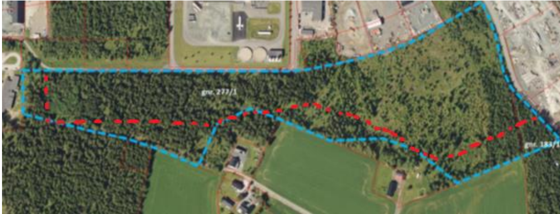
Fig 1. Utsnitt av alternativ avgrensning av planområder.