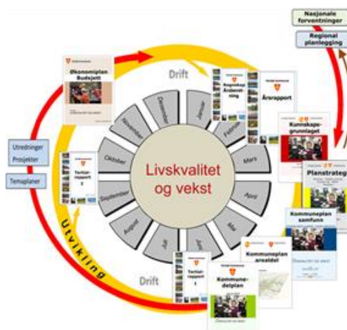
Figur 1 Plan- og styringssystemet