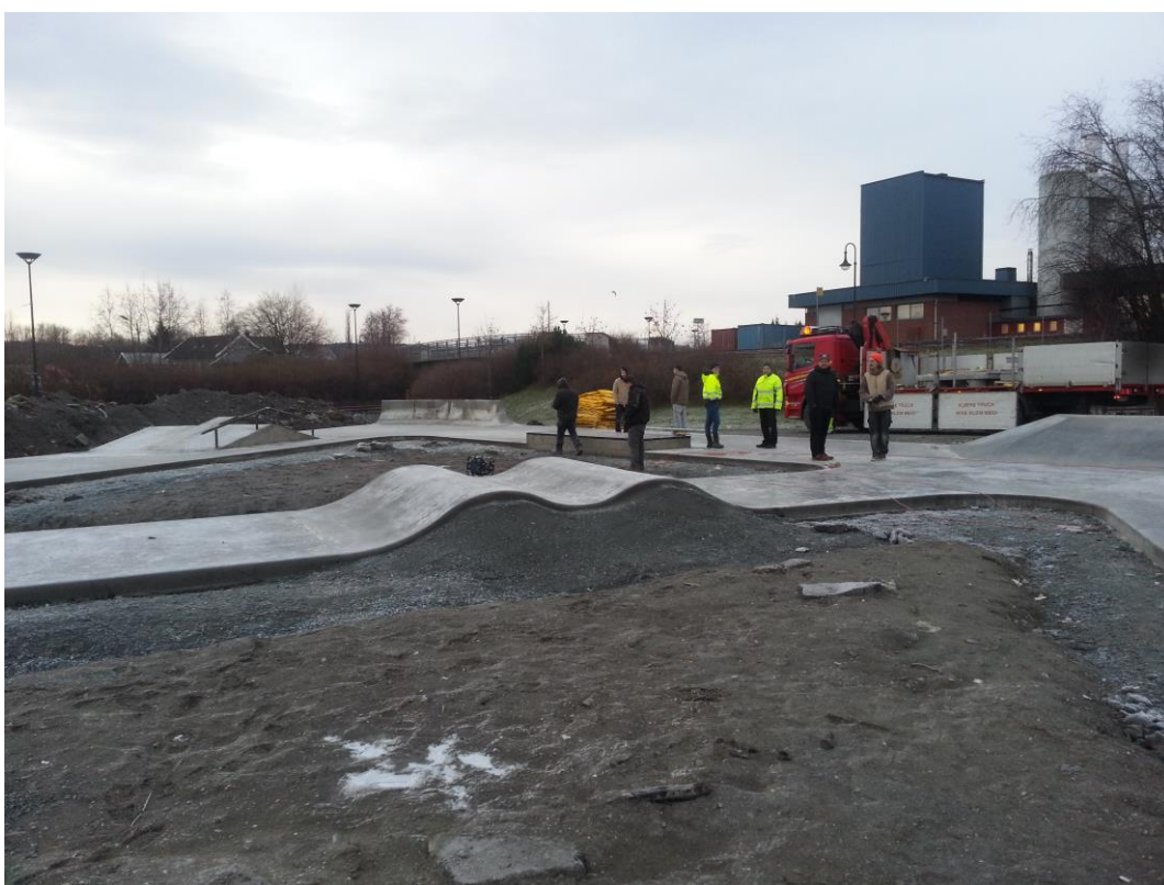
Motiv: Skateparken i Verdal