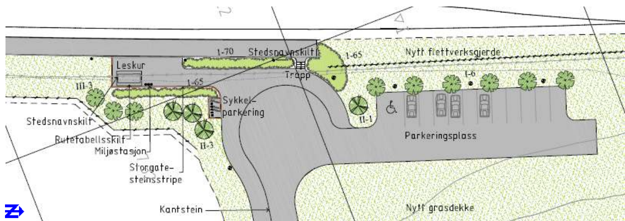
Figur: Utsnitt av illustrasjonsplan for Bergsgrav holdeplass.

Plattformen bygges 125 m lang, 3-6 m bred og 76 cm høy. Det tilrettelegges for bil- og sykkelparkering. En parkeringsplass reserveres funksjonshemmede.