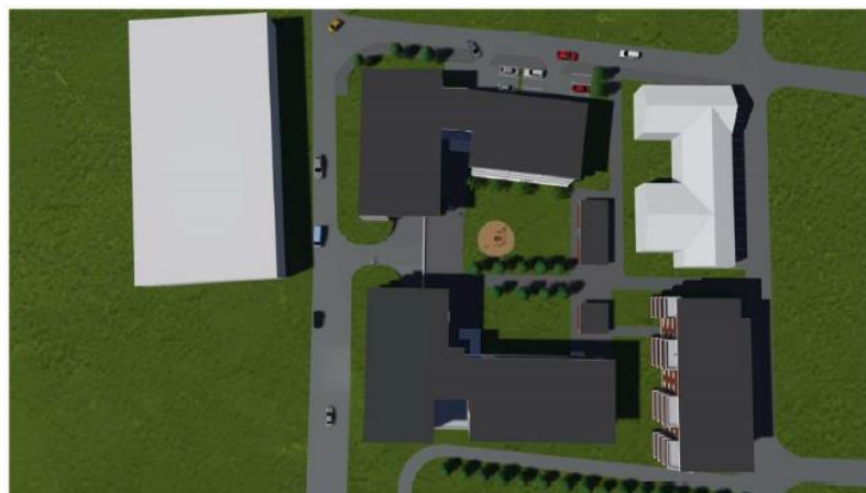
Illustrasjon som viser mulig bebyggelse.