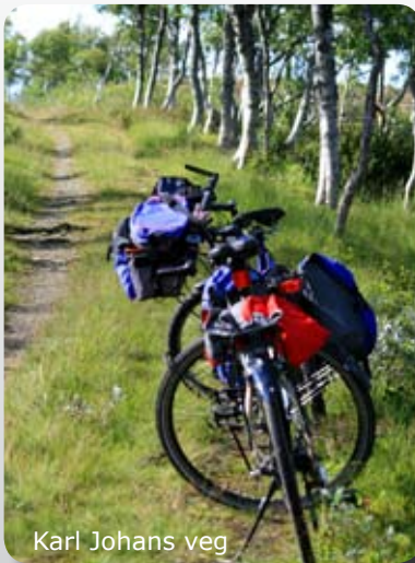
Karl Johans veg