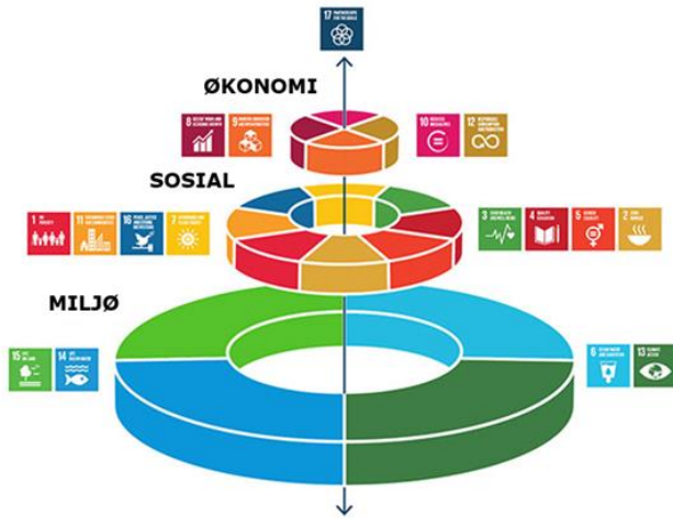
Figur: FNs bærekraftsmål inndelt i tre dimensjoner: miljømessig bærekraft, sosial bærekraft og økonomisk bærekraft. Over alle tre og bindeleddet mellom er bærekraftsmål 17 «samarbeid for å nå målene»