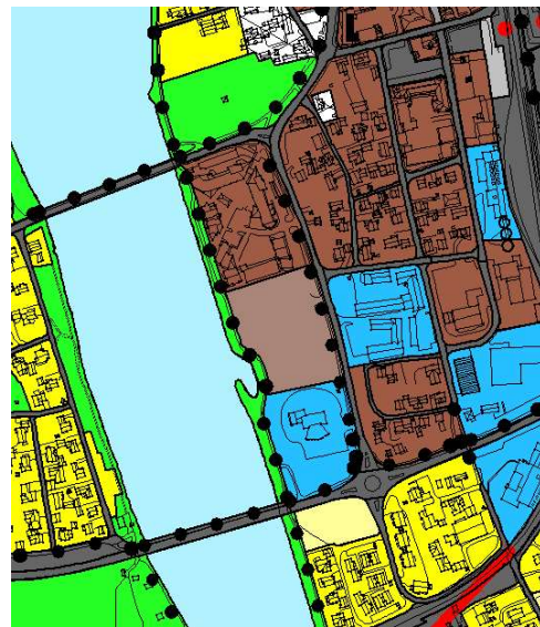
Utsnitt fra Kommunedelplan Verdal byområde